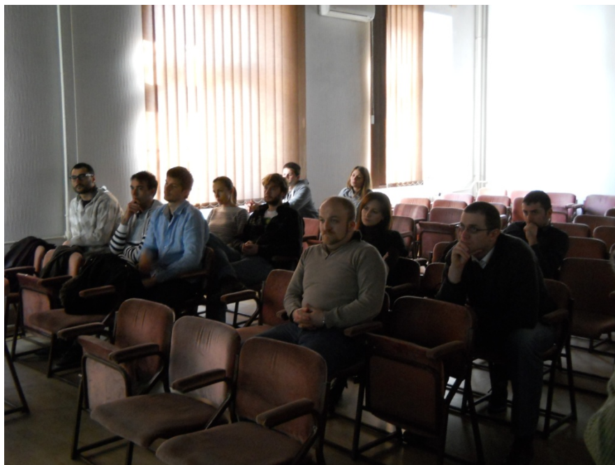
Studenti doktorskih i master studija